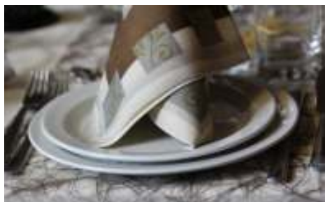
HUSK - Vi tager gerne opvasken.